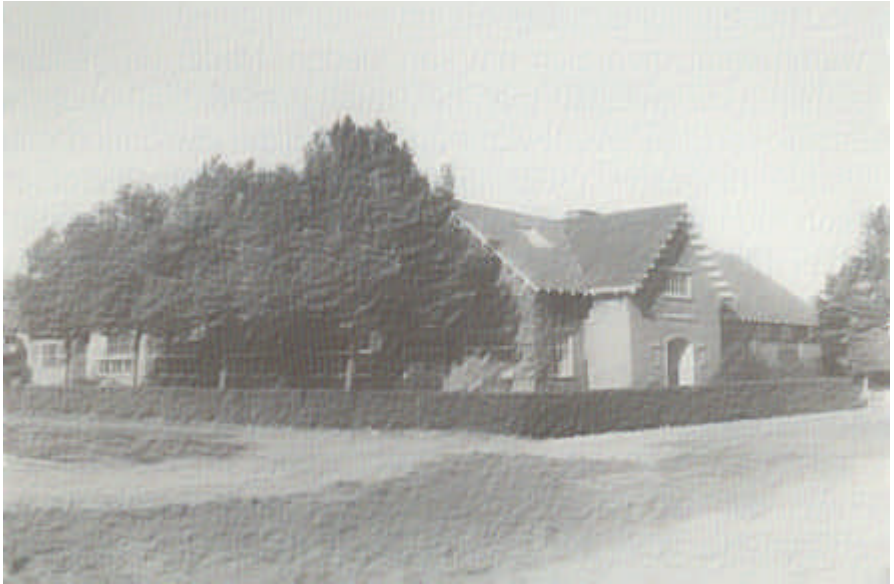
Cort van der Linden-school

Er werd regelmatig meegedaan aan diverse toernooien door het hele land, het ledental groeide en het spelpeil kwam op een hoger niveau.